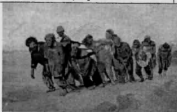
И.Е.Репин «Бурлаки на Волге»