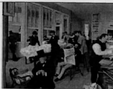
Э.Дега «Хлопковая биржа»