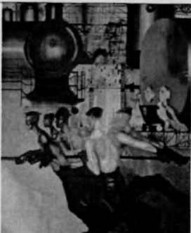
Ю.А.Пименов «Дашь тяжелую индустрию!»