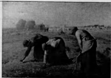
Ф.Милле «Собираательницы колосьев»

Задание 4. Логическая задача «Третье испытание». Приведите необходимую цепочку рассуждений (6 баллов).